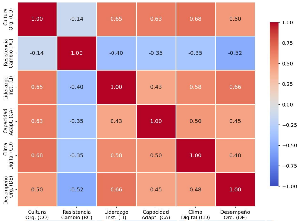
Figura 1. Mapa de calor - Matriz de correlación entre variables del estudio

El mapa de calor de la Figura 1 permite visualizar con claridad la estructura correlacional del conjunto de variables. La diagonal principal ( r = 1.00 ) refleja la autocorrelación perfecta de cada variable consigo misma. Los tonos azules más intensos señalan las correlaciones positivas más fuertes —especialmente entre CO y LI ( r = .72 ) y entre CO y CD ( r = .70 )—, mientras que el tono rojo en la celda CO–RC evidencia de manera destacada la relación negativa entre cultura organizacional abierta y resistencia tecnológica. La Tabla 3 detalla los coeficientes con sus intervalos de confianza al 95%.